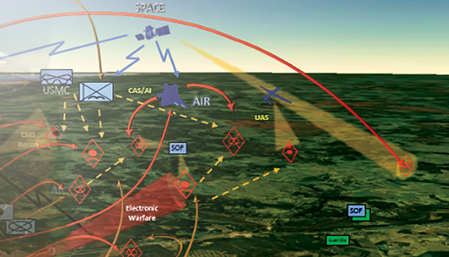
(Gráfico por Sgt Mark A. Moore II, Exército dos EUA)

adversários têm desenvolvido capacidades e conceitos que tentam remover essas vantagens, aumentando a complexidade do campo de batalha para as Forças Armadas dos Estados Unidos. Essa situação levou ao aumento das áreas comuns globais em disputa, com uma perda de dominância militar dos EUA no ar e no mar devido às tecnologias e táticas de negação de acesso. Se os oponentes realizam ações graduais ou repentinas, os Estados Unidos precisam melhorar significativamente a sua vantagem estratégica na região Indo-Ásia-Pacífico, se não, arriscarão perder terreno nas esferas militar, diplomática e econômica.